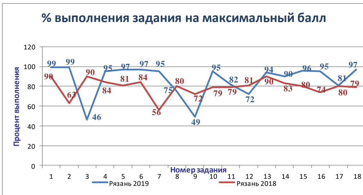
Диаграмма выполнения заданий в 2018 и 2019 годах

Структура, типы заданий и система оценивания проверочной работы по английскому языку в 2019 году и в 2018 году одинаковы, что даёт возможность провести сравнительный анализ этих работ.