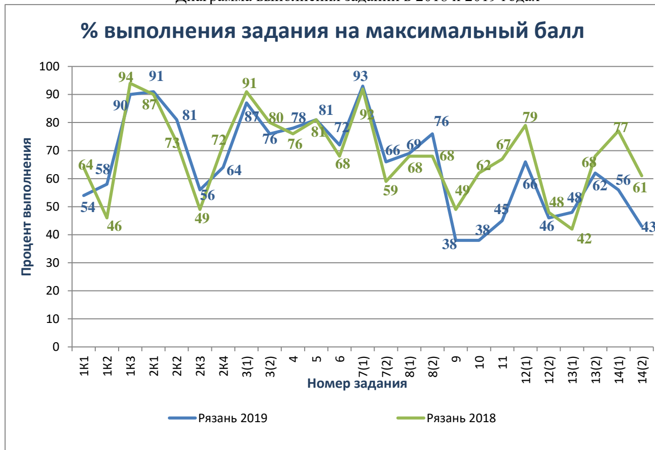
Диаграмма выполнения заданий в 2018 и 2019 годах

Как видно из диаграммы, по большинству заданий получены близкие результаты. Однако несколько заданий ВПР в 2019 году выполнены хуже, чем в 2018-м: это задания №№ 9 (38% и 49%), 10 (38% и 62%), 11 (45% и 67%), 12(1) (66% и 79%), 14(1) (56% и 77%) и 14(2) (43% и 61%).